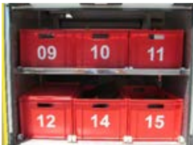
2. Cofre traseiro para equipamentos diversos Rear locker for several equipments Coffre arrière pour différent équipements Arcon trasero para vários equipos