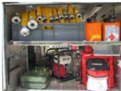
3.4.5.6. Cofres para equipamentos diversos Lockers for several equipments Coffre pour différent équipements Arcon para equipos vários