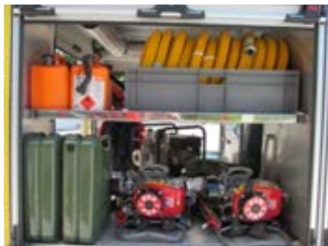
7. Cofre para material de sapador Locker for sapper equipment Coffre pour matériel sapeur Arcon para material sapador